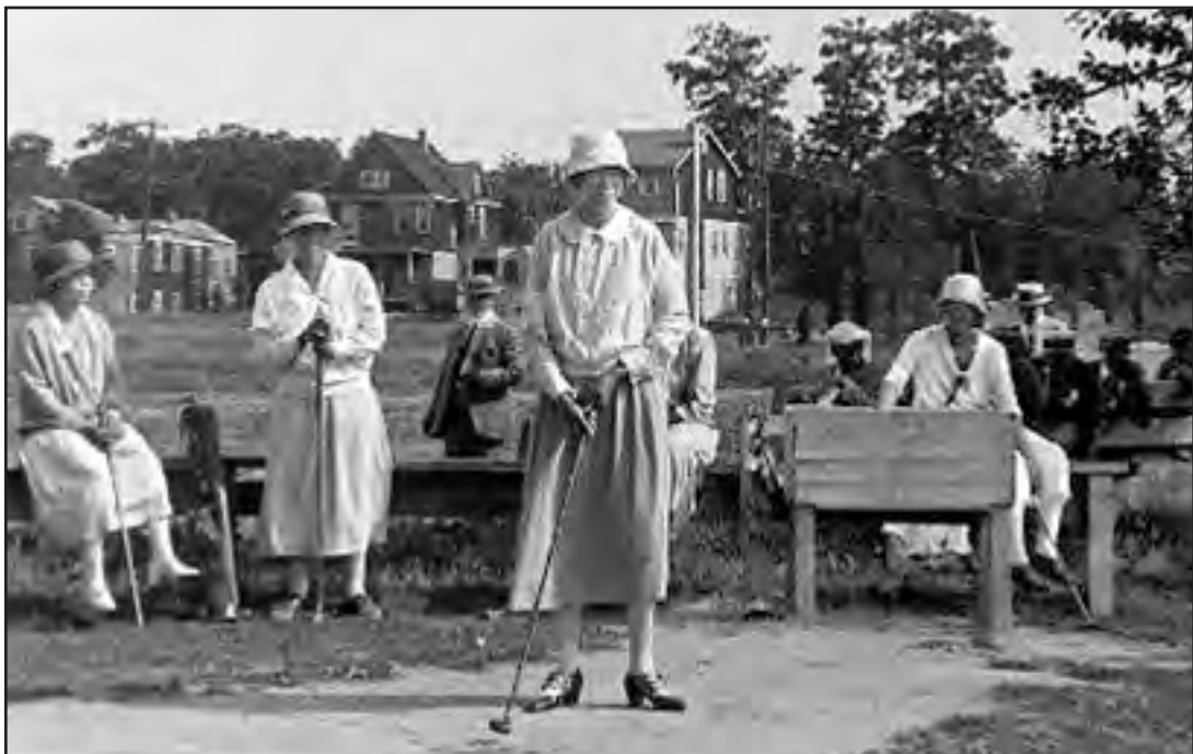
Siglo XX lo ilustra el Shady Rest Country Club en Scotch Plains, el primer club de campo de Golf propiedad de negros en los Estados Unidos.

Para información sobre todos los programas y actividades en los parques del condado de Union, ucnj.org/parks o llame al 908-527-4900.