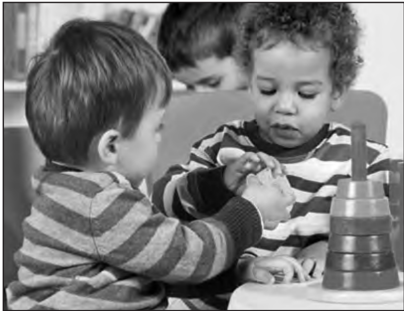
El plomo se encuentra en la pintura de muchos juguetes.

Una de las formas comunes en que los niños se pueden exponer al plomo es mediante el contacto con la pintura vieja con plomo que se haya descascarado o pulverizado en las casas o los edificios. Se pueden exponer al plomo de manera directa si tra-