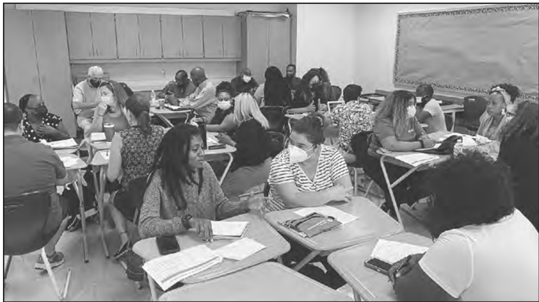
Nuevos maestros participando en la capacitación del currículo de English Language Arts, en Park Elementary School.

La oficina de Enseñanza y Aprendizaje Primera Infancia junto a la de Educación Especial dieron la bienvenida a más de 600 nuevos maestros, al inicio de este año escolar. En las sesiones de aprendizaje profesional, los nuevos maestros conocieron el plan de estudios que ahora enseñan.