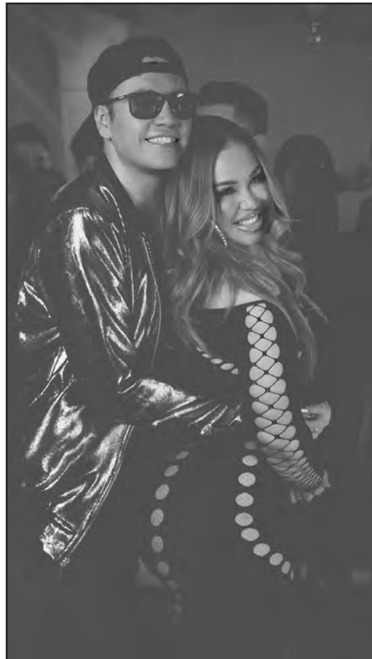
CHIQUIS y RAYMIX