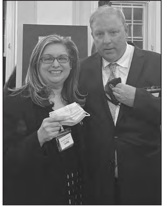
El senador Joe Cryan con la asambleísta Annette Quijano durante una ceremonia para familias trabajadoras a través de New Jersey “Make the Road New Jersey’s 2022 People’s Power Awards, dirigido por la asambleísta.

“El Gobernador comparte el mismo objetivo de proporcionar derechos básicos a los trabajadores temporales. Vamos a trabajar juntos para conseguirlo,” dijo el Senador Cryan (D-Union). “Se trata de una mano de obra invisible que ha quedado vulnerable a la explotación y el maltrato. Se les ha estafado en sus salarios, se les ha negado las prestaciones, se les ha obligado a trabajar en condiciones inseguras y